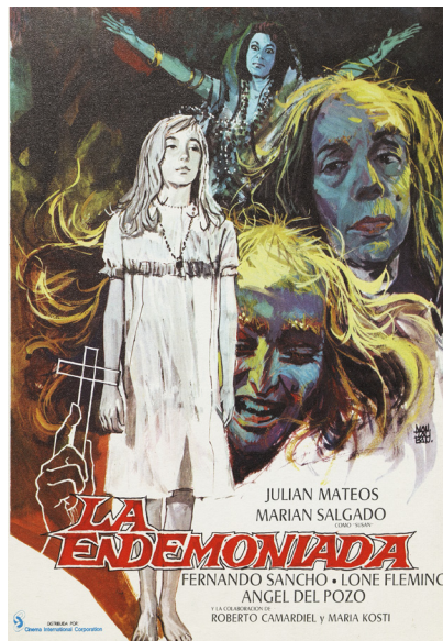
LA ENDEMONIADA (AMANDO DE OSSORIO, 1975)

Cosa de brujas es una cosa bien distinta, Pilar Bardem lidera un grupo de abuelas mefistofélicas que funcionan como representación del azar y la suerte; sin mayor contenido feminista que un matriarcado –con Saturnino García como dócil marido– aparentemente inspirado en ese rancio cliché de que las que mandan de verdad son las mujeres. Se nota que estamos todavía en 2003,